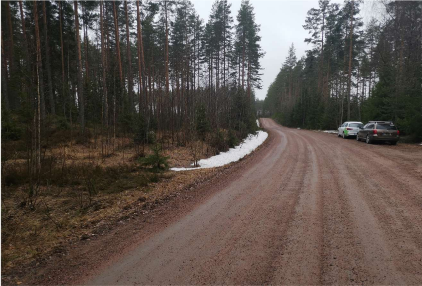
Kuva etelään, Säisän tilan piha vasemmalla.

Kuva etelään autojen kohdalla Säisän tilan piha oikealla, vasemmalla Mustilan tilan vanha laanipaikka, joka nyt esitetyissä suunnitelmissa sähköjohdon kohdalla. Vasemmalla korkean puuston takana Saunasuontien alku vasempaan Kukaskoskentielle.